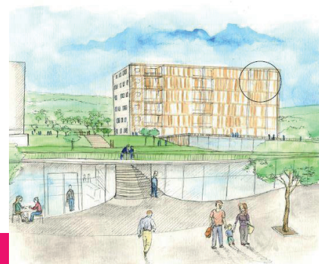
Exemple d'une production d'élèves