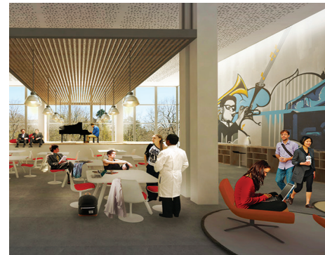
Exemples de productions d'élèves

À l'issue d'un processus de sélection, les candidats ingénieur // architecte ou architecte // ingénieur retenus intègrent le Double Coursus pour 3 ans.